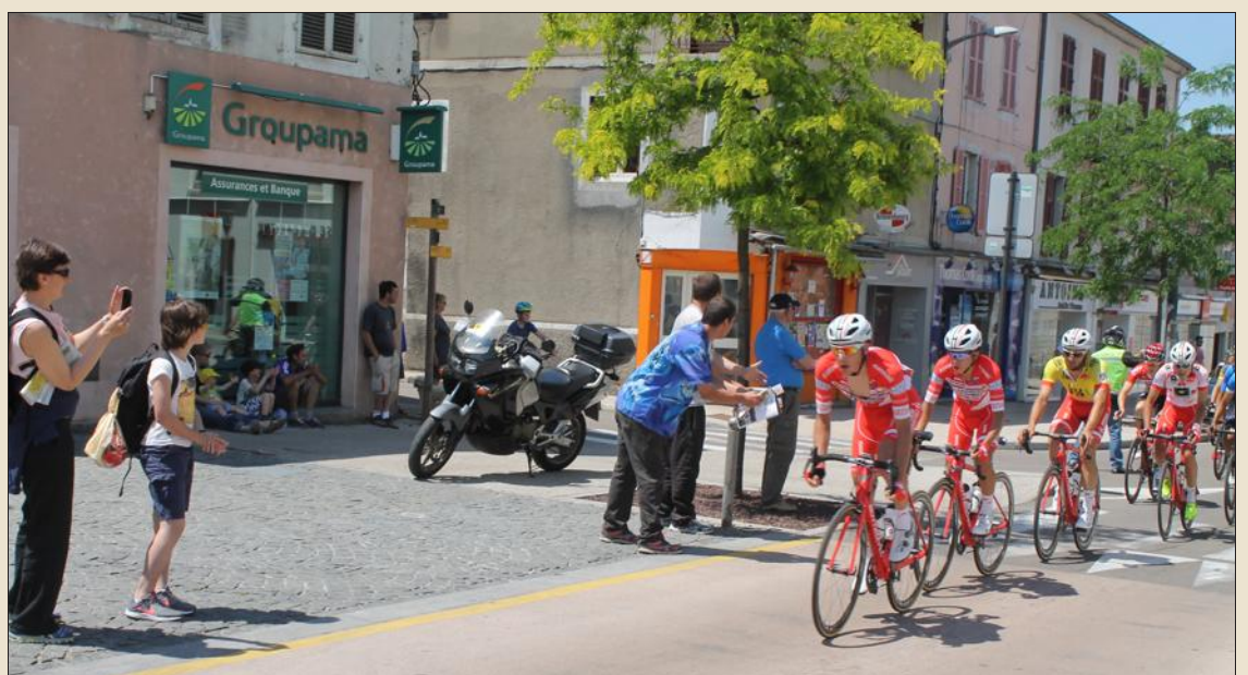
■ Le public n'était pas nombreux pour encourager les coureurs.